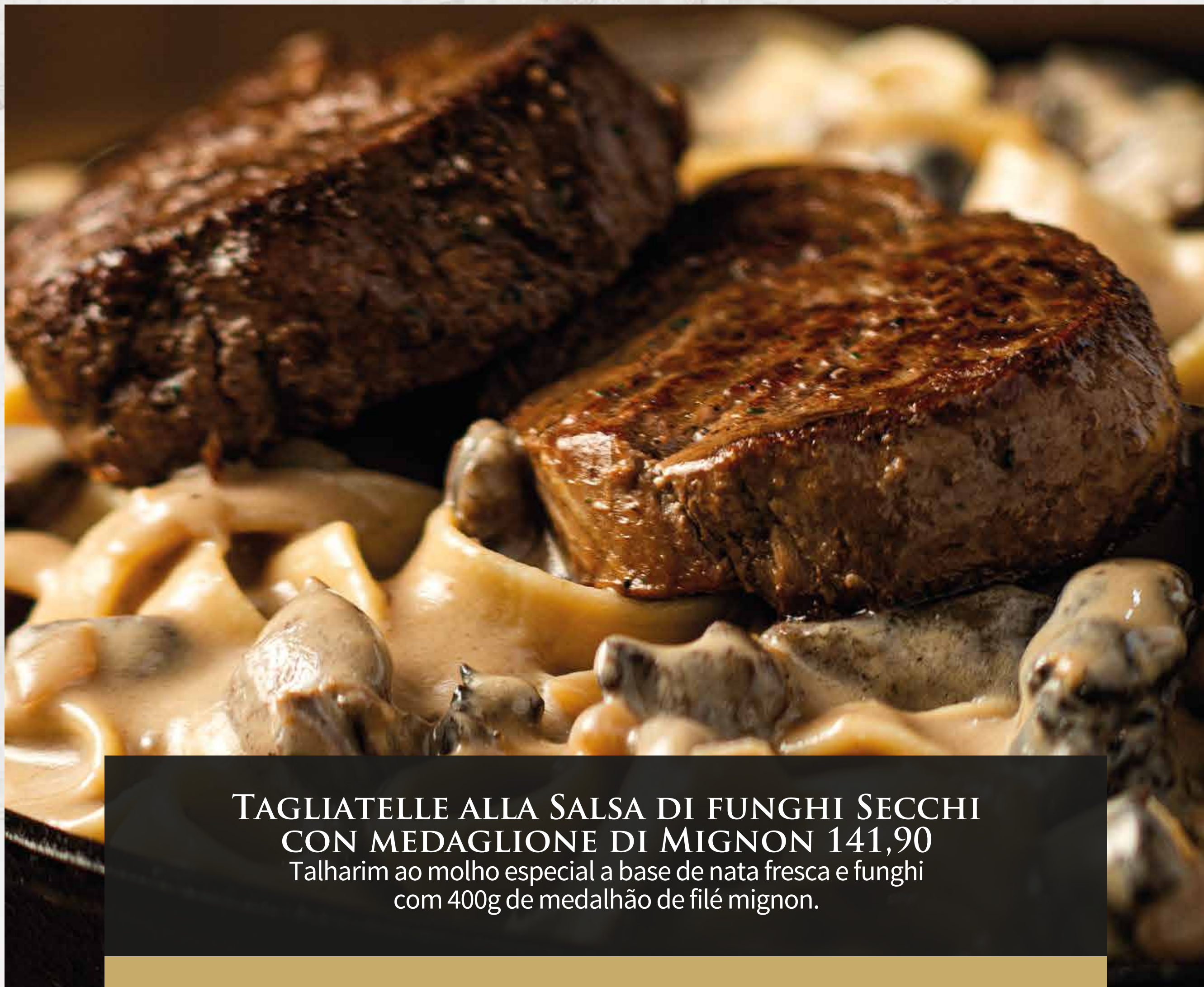
TAGLIATELLE ALLA SALSA DI FUNGHI SECCHI CON MEDAGLIONE DI MIGNON 141,90 Talha rim ao molho especial a base de nata fresca e funghi com 400g de medalhão de filé mignon.